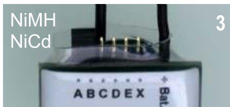
NiMH NiCd 3